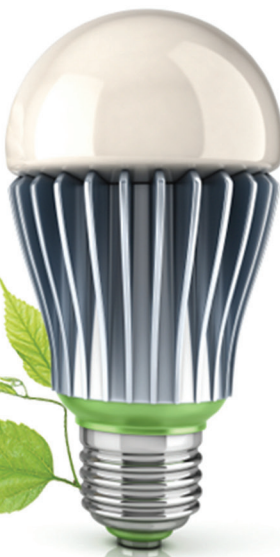
Конец XX века Светодиодная лампа