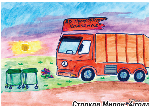
Строков Мирон, 4 года