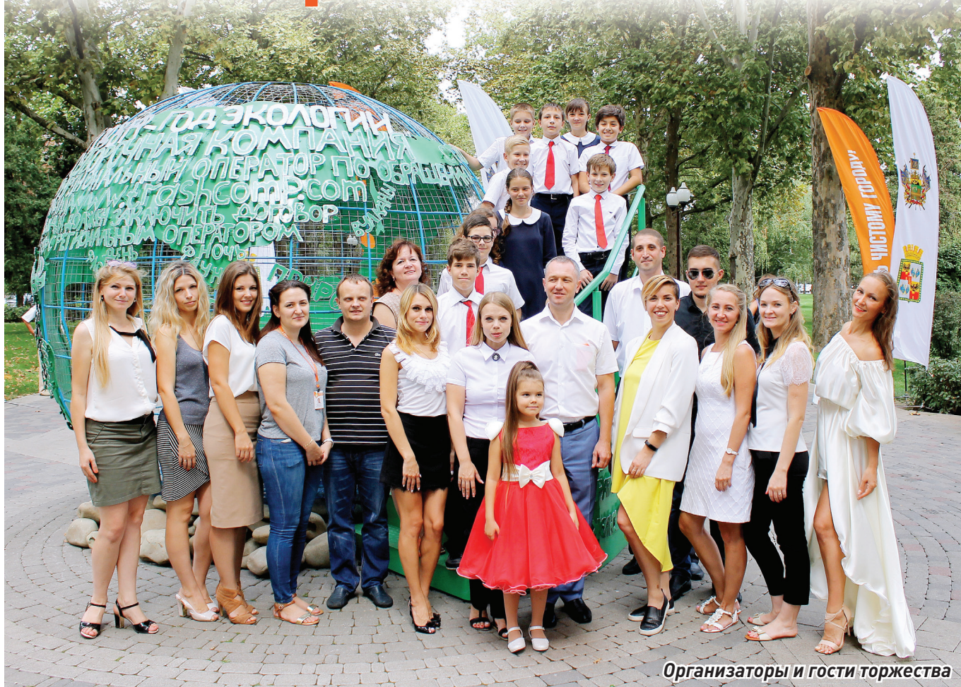
Организаторы и гости торжества

Вдохновленные мыслями об охране окружающей среды и проблеме рационального обращения с коммунальными