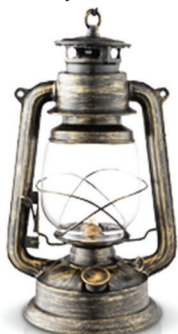
XIX век Керосиновая лампа