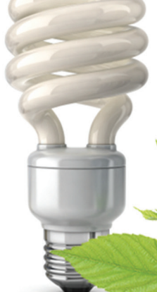
XX век Люминесцентная лампа