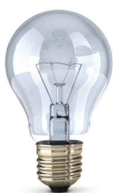
Конец XIX века Лампа накаливания