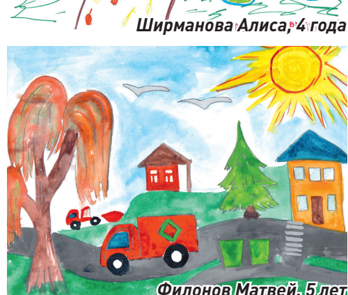
Филонов Матвей, 5 лет