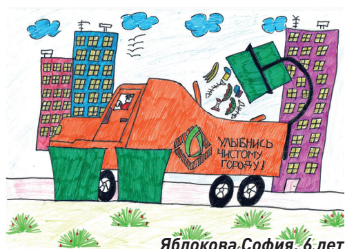
Яблокова София, 6 лет